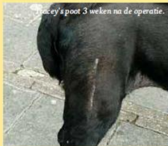
Tracey's poot 3 weken na de operatie.