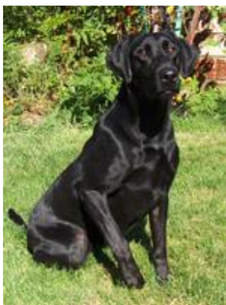
Road Warrior's Razzamatazz