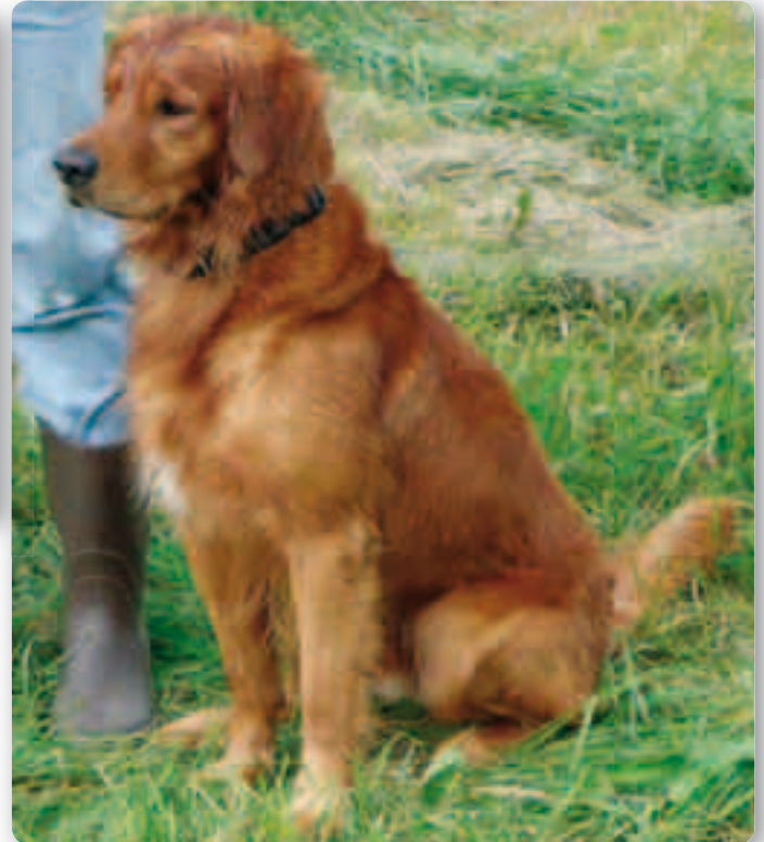
Ook de kwaliteit Goldens is in USA zeer hoog. Intelligent, snel en gezond.

trainingsgronden die in de honderden hectares lopen! Maar in de winter zou het daar weer veel te koud zijn en metershoge sneeuwmassa en dus vertrekken ze dan in een lange colonne naar Texas, waar ze ook weer een groot trainingsgebied bezitten. Ze verblijven dan meestal in grote stacaravans. Het professioneel werken met Retrievers is een soort nomadenbestaan.