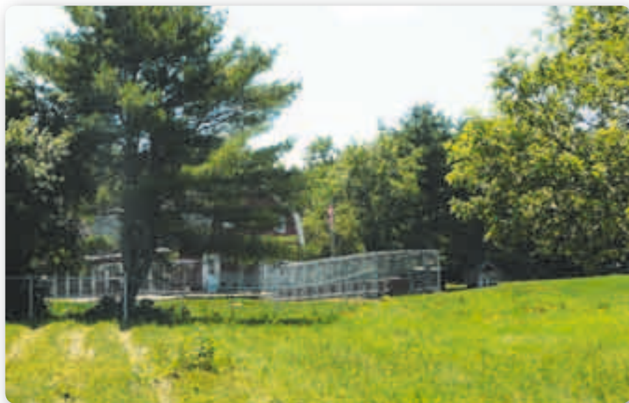
Het trainingscomplex van Dave Mosher in Maine

Veel trainers hebben voor de zomer een onderkomen in het noorden van de USA, het is daar dan lekker koel. Ze verhuizen in het najaar meestal massaal naar het zuiden, Texas, omdat er in het noorden soms meer dan een meter sneeuw ligt. Ze beschikken vaak over