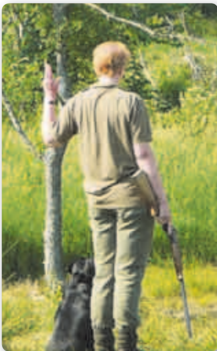
Voorjagen met geweer.

In Amerika leren alle retrievers zowel links als rechts volgen, een enorm voordeel voor jacht- en wedstrijdsituaties.