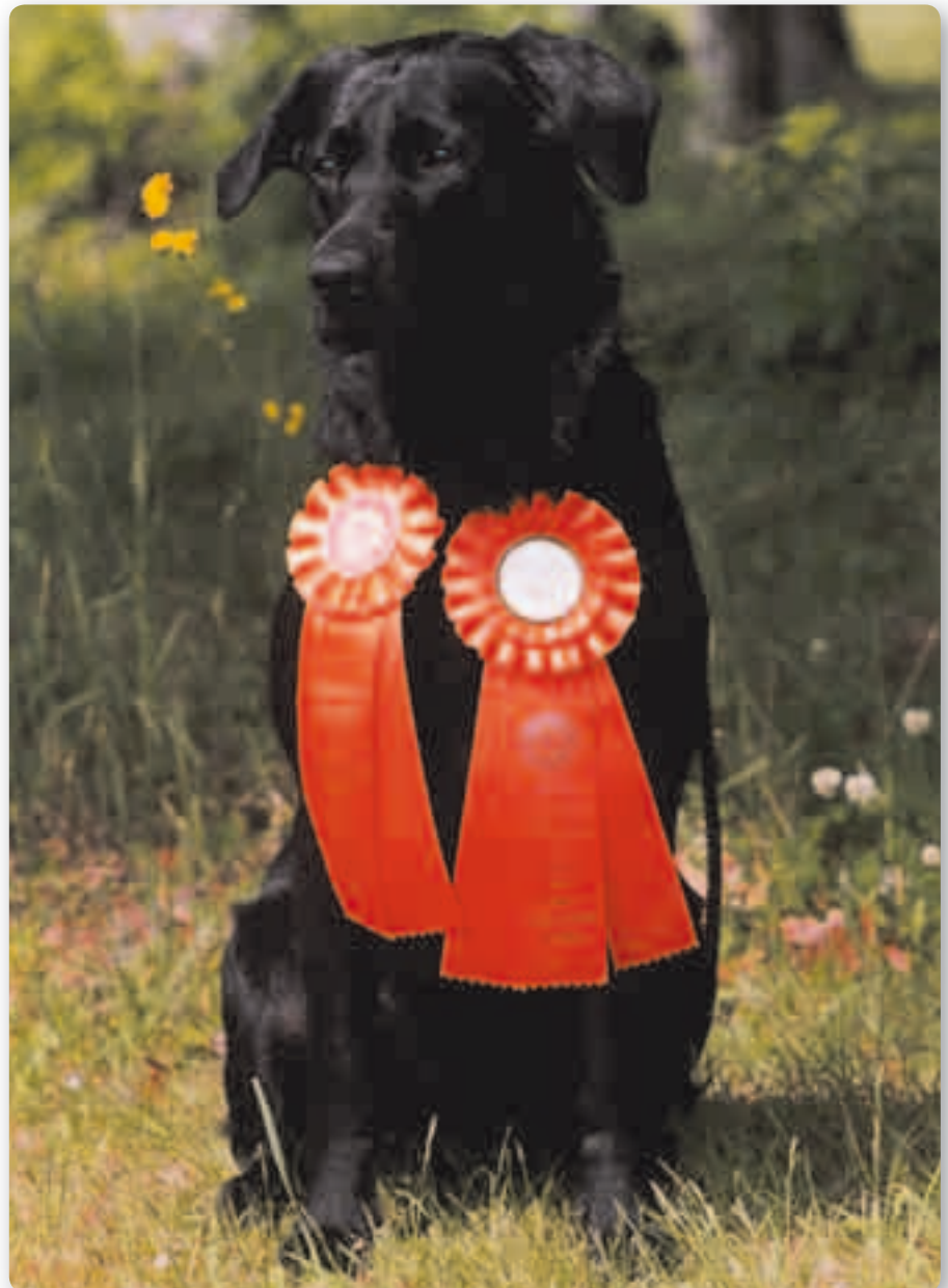
Het felbegeerde oranje AKC-rozet.

Mr.Monty deel 1) en gaat dan op advies van de Marshall naar hide 2 om te wachten dat men wordt opgeroepen. Een van de keurmeesters benadert je en vraagt je heel officieel of je op de hoogte bent met de reglementen van de AKC en loopt dan terug naar zijn collega. Zodra de keurmeesters zien dat de kandidaat gereed staat, hoor je de magische woorden "Guns up" en staan de geweren en werpers klaar en loop je naar de keurmeesters toe. Tijdens het oplopen, bevinden de keurmeesters zich achter je. In dit stadium mag je de hond (alléén in Junior!!) nog aan de riem houden. Vervolgens klinkt een schot en wordt een apport geschoten, dit is de "Live bird", en pas als